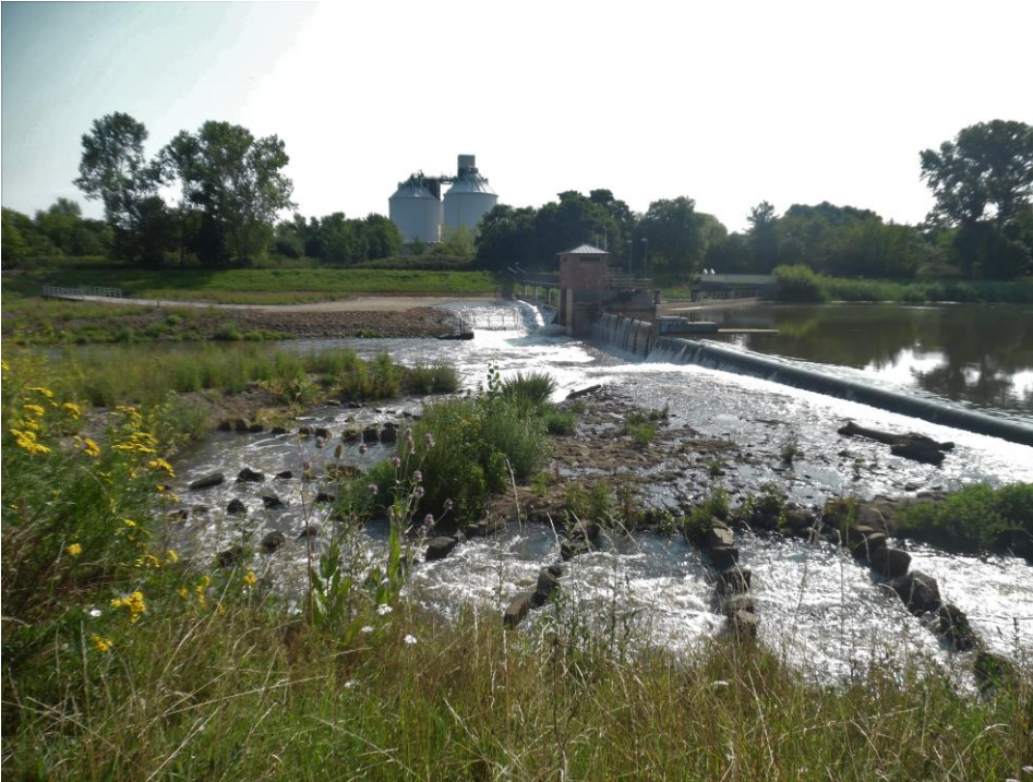
Wehr der Neue Luppe, Foto: Maria Vlaic – NABU Sachsen